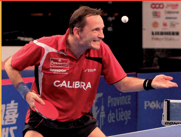
JEAN-MICHEL SAIVE (25x BELGISCH KAMPIOEN - 7 OLYMPISCHE DEELNAMES)

CATERING VOORZIEN ADD : 6€ - VVK : 5€ Kinderen-12jaar : gratis